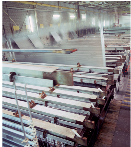
Bild: Heißverdichtungsbad

Anhand eines nachfolgend geschilderten Praxisbeispiels wird verdeutlicht, dass durch den Einsatz eines geeigneten automatischen Rückspülfilters einerseits die Produktqualität verbesserbar und weiters eine beachtliche Betriebskosteneinsparung erreichbar ist. Bei einem führenden deutschen Unternehmen in der Oberflächentechnik konnte im Bereich der Eloxalproduktion aufgrund höheren Absatzes die Fertigungskapazität deutlich erhöht werden.